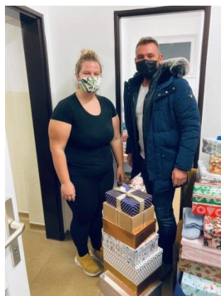
Darčeky pre seniorov v domove dôchodcov v Pezinku

Operačný program sa v Komunikačnej stratégii zaväzuje umožniť rovnaký prístup k informáciám pre všetkých občanov. Je zameraný na systematickú podporu optimalizácie verejných politík a poskytovaných služieb všetkým občanom v súlade so zásadou rovnakého zaobchádzania. Jedným z horizontálnych princípov OP EVS je rovnosť príležitostí a nediskriminácia. Ministerstvo vnútra ako riadiaci orgán sa v ňom zaväzuje zabezpečiť prístup k informáciám prostredníctvom webového sídla a jeho rozhrania „blind friendly“. Realizácia všetkých komunikačných aktivít bude rešpektovať princípy na zabezpečenie prístupnosti informácií aj pre osoby so zdravotným postihnutím a bude mať nediskriminačný charakter. To znamená, že cieľom komunikačnej stratégie je taktiež „zabezpečiť prevenciu, identifikáciu a odstraňovanie bariér pre osoby so zdravotným postihnutím brániacich prístupnosti k informáciám, informačným systémom a službám vrátane komunikácie s verejnou správou a službami poskytovanými verejnosti.“