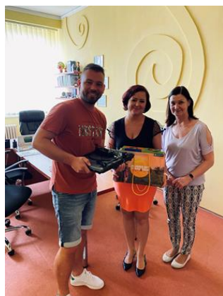
Technika pre Základnú školu Sever v Trebišove