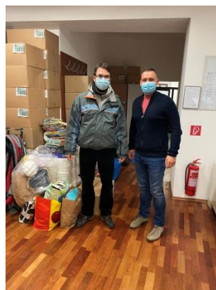
Zbierka šatstva, kníh a techniky pre Základnú školu Plavecký Štvrtok