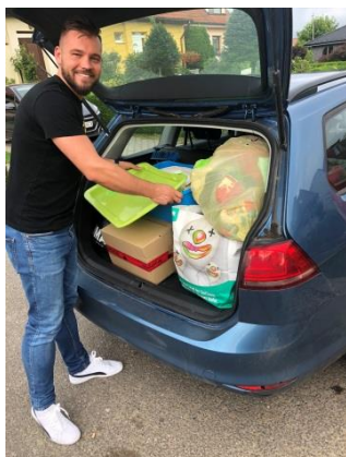
Šatstvo pre spojenú školu Internátnu v Trebišove

OP EVS participuje aj v oblasti spoločenskej zodpovednosti voči všetkým skupinám znevýhodnených občanov. V minulom roku zorganizovali zamestnanci sekcie európskych programov Ministerstva vnútra zbierku šatstva, obuvi, kníh, hračiek a techniky pre znevýhodnené skupiny obyvateľstva. Zbierky putovali na spojenú školu internátnu v Trebišove, do detského domova v Sečovciach, Základnú školu Plavecký Štvrtok a tiež na Základnú školu Sever v Trebišove. Vďaka kampani: „KOĽKO LÁSKY SA ZMESTÍ DO KRABICE OD TOPÁNOK?“ zamestnanci odovzdali darčeky pre seniorov v domove dôchodcov v Pezinku. Zamestnanci OP EVS sa budú v roku 2021 zúčastňovať aj na ďalších podobných podujatiach.