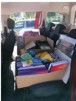
Školské potreby pre deti v Detskom domove v Sečovciach